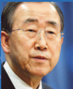
Ban Ki-moon Generalsekretär der Vereinten Nationen